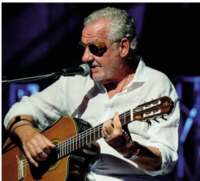
Il cantautore e compositore astigiano Giorgio Conte

D'altra parte, chiosa lui stesso, «chi l'ha detto che un titolo debba